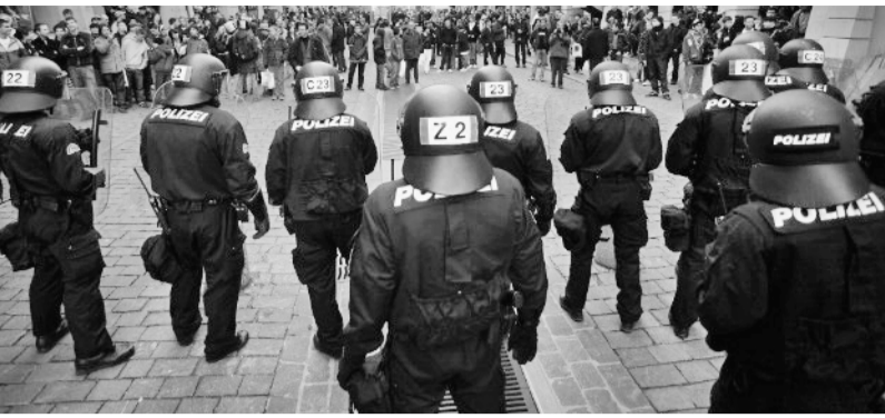
Ziel des neuen Artikels im Kundgebungsreglement ist erklärermassen die «Abschreckung».

Kaum sind die Bürgerlichen mit ihren Plänen, in Bern grundsätzlich nur noch Platzkundgebungen zuzulassen, vor dem Verwaltungsreglement erneut verschärft werden. Am 13. Juni 2010 müssen wir uns gegen eine weitere Einschränkung des Grundrechts auf Versammlungsfreiheit wehren. Das Grüne Bündnis ruft dazu auf, den neuen «Entfernungsartikel» abzulehnen.